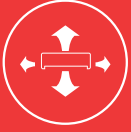
Geniş Açılı Hava Akışı