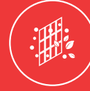
Yüksek Yoğunluklu Filtre