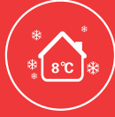
Follow Me Modu