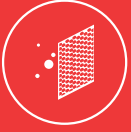
Soğuk Katalizör Filtresi