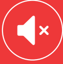
Düşük Ses Özelliği